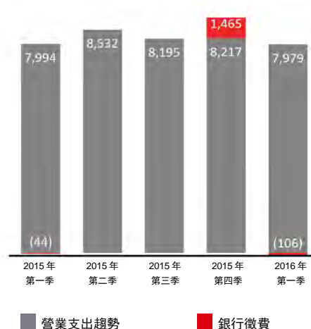
2015 年第一季至 2016 年第一季的營業支出趨勢 (百萬美元)